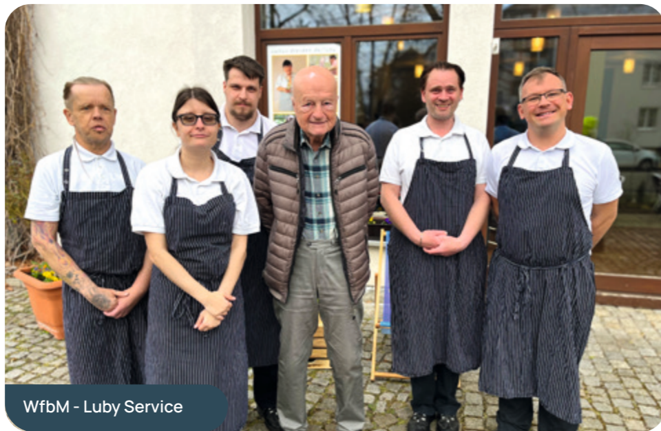
WfbM - Luby Service

Das gesamte Team des Café Luby 1 ist überwältigt von dieser Zuwendung, bedankt sich herzlich und freut sich darauf, das Café weiterhin als einen Ort der Begegnung und des Wohlfühlens für alle Gäste zu gestalten!