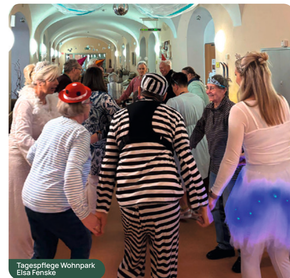
Tagespflege Wohnpark Elsa Fenske

Mit einer stimmungsvollen Winterparty hat die Tagespflege im Wohnpark Elsa Fenske am 7. März den Winter gebührend verabschiedet. Passend zur Faschingszeit verwandelten sich die Mitarbeiterinnen in zauberhafte Winterfeen und Engel, während die Seniorinnen und Senioren eine süße Überraschung erwartete: köstliche Krapfen und eine eisblaue Winterbowl. Natürlich durfte auch Musik nicht fehlen – mit viel Schwung und guter Laune wurde zu den beliebtesten Karneval-Hits gesungen und ausgelassen getanzt. Die gesamte, mit viel Liebe zum Detail, gestaltete Winterdekoration ließ den Zauber der kalten Jahreszeit noch einmal aufleben. Ein besonderes Highlight war die kreative Fotokulisse in Form einer Schneekugel, die für zahlreiche schöne Erinnerungsfotos sorgte. Trotz der festlichen Stimmung wächst die Vorfreude auf den Frühling: Bald schon können gemeinsame Ausflüge, beispielsweise in den Schlosspark Pillnitz, wieder ohne dicke Wintermäntel genossen werden.