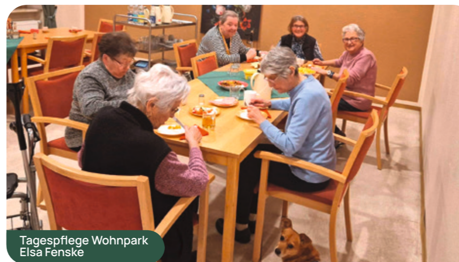
Tagespflege Wohnpark Elsa Fenske

Die Damen und Herren, die sich fast alle aus der Nachbarschaft kannten, nutzten dabei die Gelegenheit, um sich über die Ereignisse auszutauschen und gemeinsam zur Ruhe zu kommen. Am nächsten Tag wurden die Gäste weiterhin in der Tagespflege betreut, bis die Entschärfung der Bombe erfolgreich abgeschlossen war. Dabei konnten sie einen wunderbaren Einblick in die vielseitigen Angebote unserer Tagespflege erhalten. Einige waren so begeistert, dass sie schon ankündigten, künftig häufiger vorbeizuschauen!