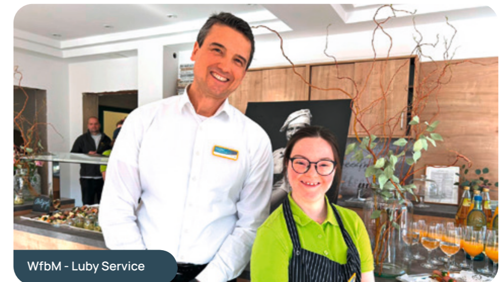
WfbM - Luby Service

Es herrschte große Begeisterung und die Vorfreude darauf, wieder Zeit im Café zu verbringen, war spürbar. Ein herzliches Dankeschön an alle, die uns während der Bau- und Renovierungsphase unterstützt haben! Wir freuen uns auf Ihren Besuch und darauf, gemeinsam mit Ihnen das Café Luby 2 wieder mit Leben zu füllen.