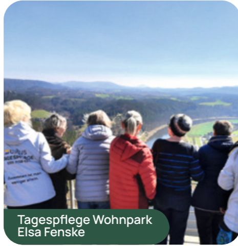
Tagespflege Wohnpark Elsa Fenske

Weitere spannende Ausflüge der Tagespflege führten im März auf den Karl Erdbeerhof Döbeln oder in das Puppenmuseum Lichtenberg, woliebevoll gestaltete Exponate Erinnerungen weckten. Das Lingnerschloss begeisterte mit einem herrlichen Blick über Dresden und die Aussichtsplattform der Bastei bot ein spektakuläres Panorama auf das Elbsandsteingebirge. Technikfans kamen beim Besuch des Fernsehturms auf ihre Kosten, bevor die Woche mit der Simson-Ausstellung im Elbe Park nostalgisch ausklang.