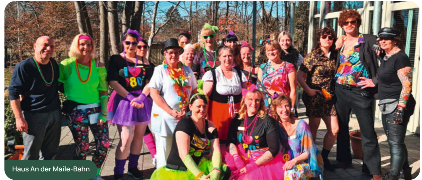
Haus An der Maile-Bahn

Mit schönen Erinnerungen im Gepäck ging es zum Mittag wieder zurück in das Fachpflegezentrum. Das Kinderlachen, die Kinderaugen und Beobachtungen vom einzelnen Spielszenen im Garten werden noch in langer Erinnerung bleiben oder für ein Gespräch am Nachmittag sorgen.