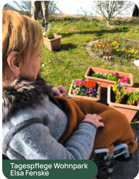
Tagespflege Wohnpark Elsa Fenske

Passend zum kalendarischen Frühlingserwachen am 20. März folgte das Fachpflegezentrum Altleuben dem Ruf der erwachenden Natur. Die Kinder von Pat's Dahlienheim luden die Bewohnerinnen und Bewohner zu einer gemeinsamen Pflanzaktion ein. Schon auf dem Weg dorthin zeigte sich der Frühling von seiner schönsten Seite und gemeinsam mit den Kindern wurden Frühlingslieder angestimmt. Im Garten angekommen, wurden die mitgebrachten Blumen nach Farben sortiert und teilweise konkret benannt. Dann ging es auch schon ans Pflanzen: Die motivierten Kinder flitzten los, um sich eine Schaufel zu schnappen und den vielen bunten Blümchen ein neues Zuhause in Beeten und Kübeln